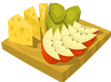
Aperitivo, picoteo, acompañamiento, o postre