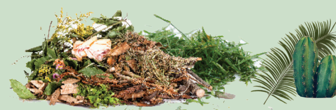
Grass, Weeds, Plants, Tree Limbs, Wood Chips, Dead Plants, Brush, Garden Trimmings, Leaves, Cut Flowers Palm fronds, Yucca, Cacti