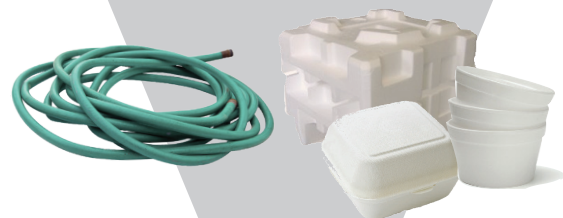
Hoses, Cords & Wire, Polystyrene Foam & Packaging