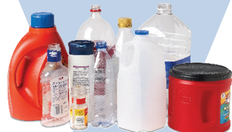
Empty Plastic Bottles & Containers

No plastic bags. Please do not bag recyclables, keep loose.