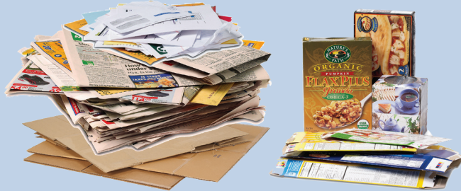
Clean Paper, Magazines, Newspaper, Junk Mail, Cardboard, Cardboard Egg Cartons, Cereal Boxes