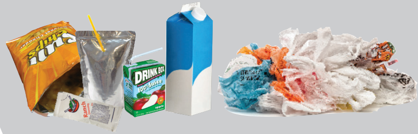
Snack & Chip Bags, Drink Pouches & Boxes, Wrappers, Plastic Wrap, Bags & Other Film Plastic