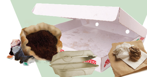
Pizza Boxes & Food-Soiled Paper, Napkins, Paper Towels, Coffee Grounds, Tea Bags