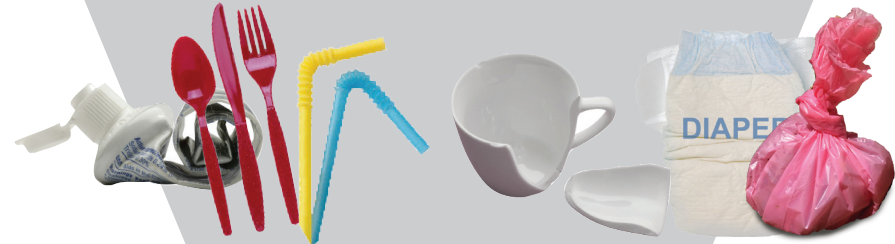
Plastic Utensils, Plastic Straws Broken Glass & Dishes Diapers & Pet Waste