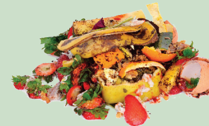
Food Scraps, Including Egg Shells, Meat & Bones