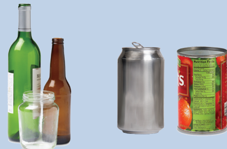
Empty Glass Bottles & Jars, All Metal Beverage & Food Cans