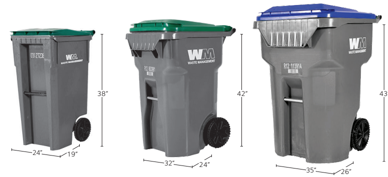
35-Gallon Cart Organics (green lid) 64-Gallon Cart Organics (green lid) 96-Gallon Cart Trash (grey lid) Recycling (blue lid)