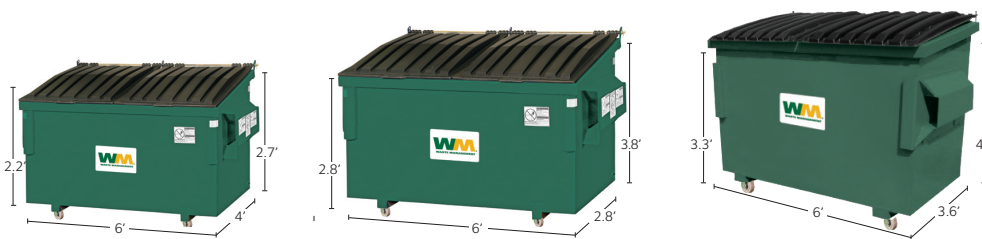
1 Cubic Yard Container* Recycling, Organics 2 Cubic Yard Container* Recycling, Organics 3 Cubic Yard Container* Recycling, Organics